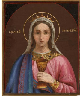
【図3】 聖バーバラのモザイク・イコン(19世紀末、国立宗教史博物館所蔵)