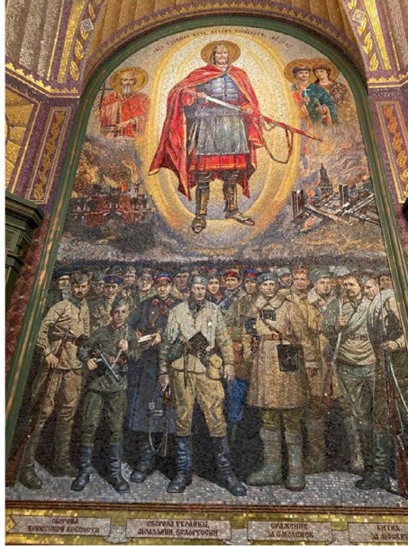
【図5】 キリスト復活総主教大聖堂のアレクサンドル・ネフスキーのモザイク