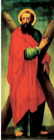
【図2】 使徒アンデレのイコン(18世紀末、キエフ(キエフ)地域)