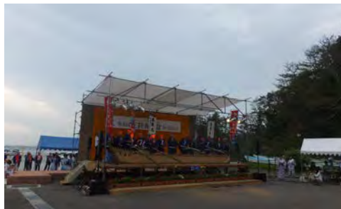
写真1 第五回三陸海の盆（平成27年8月11日）

ボランティアや財団などからの支援を受けての復活や、避難・移住先での再現といったところにおいて、祭りや儀礼の、民俗芸能を営んできた基盤が変容することに留意する必要があるだろう。そのうえで、こうした取り組みの長期的な展望や可能性に注目していきたい。 7)