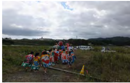
写真3 平成二十五年八幡神社例祭で神輿を担ぐ中学生 (平成25年9月29日)

芸能や祭りといった身体的行為、そして信仰心や祖先とのつながりが、その土地を基盤にして生まれ、同時に、その土地の「風土」を作っていく。風土は単なる自然ではなく、住民の人たち自身のアイデンティティーとなり、住民の人たちの存在そのものにとって不可欠な要素となる。そのようなことを念頭に、次章を記した。