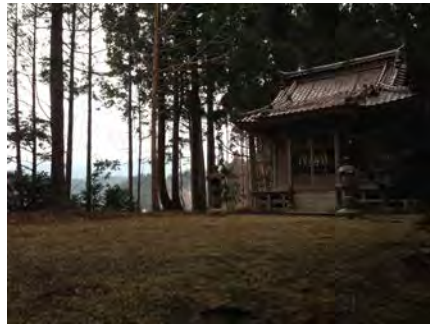
写真2 八幡神社境内と御社殿（平成27年3月8日）

その年の御例祭は、地区の若者たちの「神輿で地区を元気づけたい」という熱意のもと行われ、以後、毎年斎行されている。私は翌平成二十四年