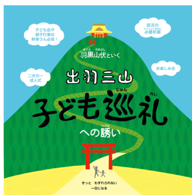
(出羽三山子供巡礼ポスター)