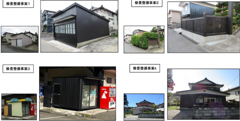
(「鶴岡市歴史的風致維持向上計画 令和2年度進行管理・評価シート」より 6) )

取組を支援」 7) するための仕組みで、地域に存在する個別の文化財の価値ではなく、それらをつなぐ面的な「ストーリー」が重視される。