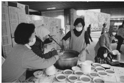
2011年4月3日 いわき市内避難所での炊き出し

シディキ ここでいろいろ荷物が入ってくるのを分配したり、避難所行って何か欲しいものはないとか聞いてまわったり。配るのはね、女性たち。