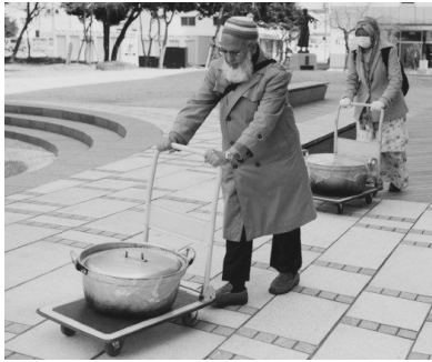
炊き出しに向かうJITのメンバー（2011年4月3日いわき市） （JITのHPより転載）

震災が発生したその日のうちから、被災地に行こうと動き始めたムスリムたちが東京にいた。その決断力・実行力はどこから来ていたのか。信仰の力なのか、イスラムのイメージを良くしたかったのか。「美談」で終わらせず、彼（女）らの信仰と社会活動の関係について理解を深めるため、インタビューに赴いた。（2014年12月13日東京大塚モスクにて収録）